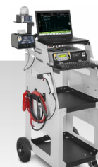
BSUFLASH XL-vogn 028890