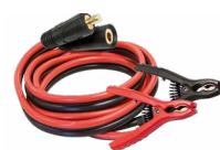
Leveres med klemmer (5 m – 25 mm 2 )