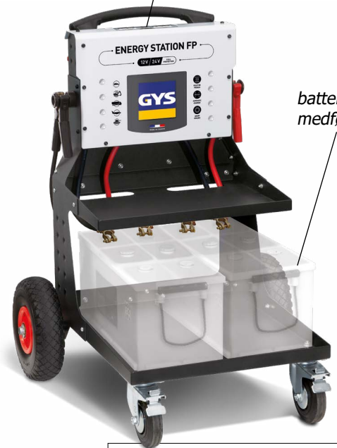
batterier medfølger ikke