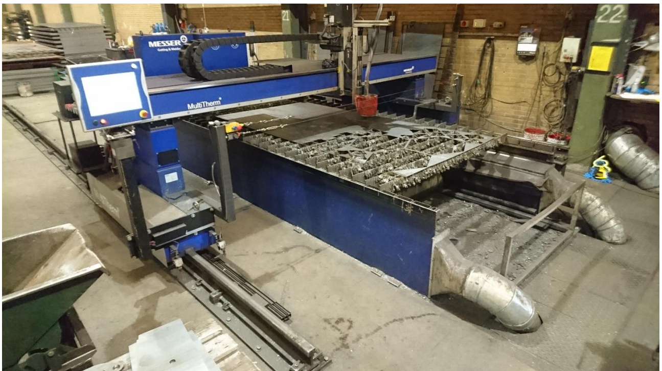
Messer Cutting Systems - MultiTherm 4000

LØWENER Industri ApS kan om ønsket stille maskinen op, forestå igangsætning og undervisning