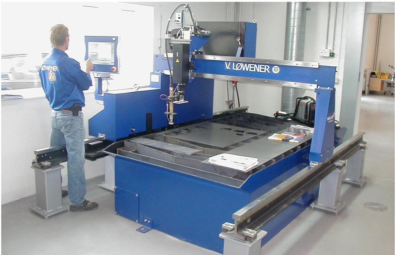
Messer Cutting Systems – ComCut 21 med skærebord

LØWENER Industri ApS kan om ønsket stille maskinen op, forestå igangsætning og undervisning