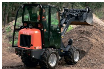
Kubota RT150-2 minilæsser med kabine - 1.685 kg. Læs mere HER

Maskinerne i den nye RT-serie er beregnet til en lang række opgaver inden for bl.a. byggeri og anlæg, gartnerier, landbrug og entreprenører.