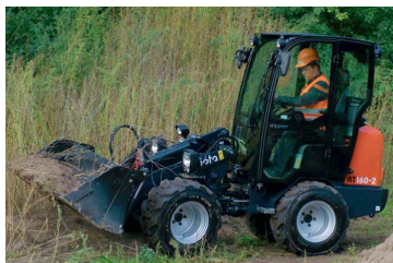
Kubota RT160-2 med foldbar rops - 1.525 kg. Læs mere HER