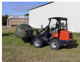
Kubota RT270-2 med foldbar rops - 2.800 kg. Læs mere HER