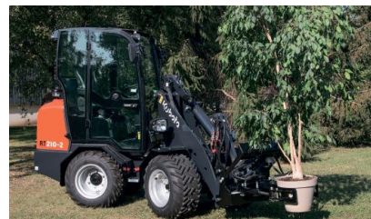
Kubota RT 210-2 med foldbar rops - 2.100 kg. Læs mere HER