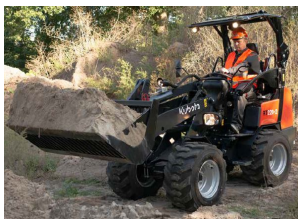
Kubota RT 220-2 med foldbar rops - 2.200 kg. Læs mere HER