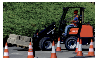
Kubota RT280-2. Fås både med foldbar rops og med halvtag - 2.800 kg. Læs mere HER