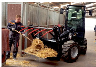
Kubota RT260-2. Fås både med kabine og med halvtag - 2.605 / 2400 kg. Læs mere HER