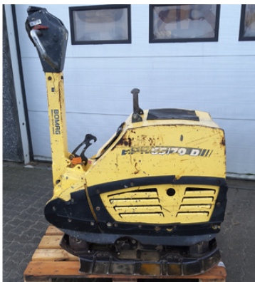
Brugt Bomag BPR 65/70 frem/bak vibrationsplade PRIS DKK 38.000,-