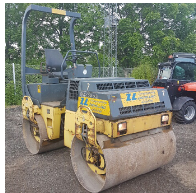
Brugt Bomag BW 138 AD knækstyret tandentromle Fra 1998. Kørt 2.250 timer PRIS DKK 56.000,-

Se hele vores udvalg af brugt komprimeringsmateriel HER Vi har fra den lille jordloppe til den store lossepladskompaktor