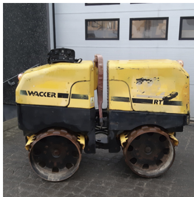
Brugt Wacker RT82 råjordstromle Fra 2006. Kørt 440 timer PRIS DKK 40.000,-