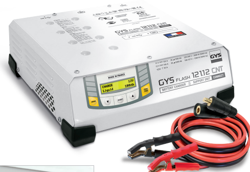
Leveres med kabler (5 m - 25 mm 2 )