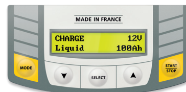
Intuitiv grænseflade på 22 sprog